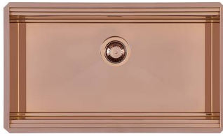
Évier Milanello Copper Workstation 1034 858