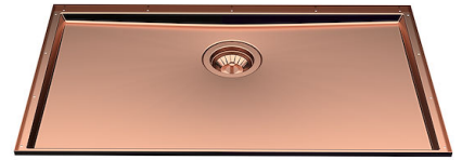
Évier Phantom Base Copper 5557 148